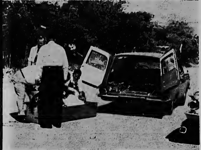
Esta foto aki por weta e momento cu e cadaver di e muher cu a ser asesiná ta ser pone den e caha pa ser transporta pa Hospital Sint Elisabeth, caminda dokternan a trata di salba e yiu cu mester a nace. Saki tampoco no tabatin exito y e yiu tambe a resulta morto.

SAIGON -- UPI -- Un vocero militar a informá cu e avionnan di marina norteamericano a atacá pa di cuatro blaha obhetivonan den e zona industrial situá entre Haiphong y Hanói.